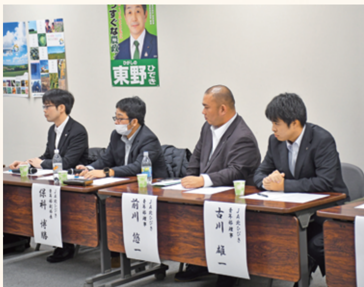
▲回答を聞く青年部員のように