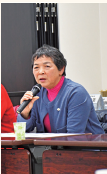
▲質問をする女性部中山部長