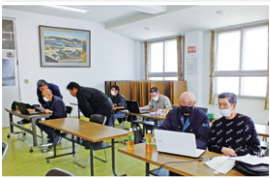
仕訳の説明を受ける参加者