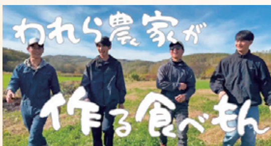
▲優秀賞を受賞した動画