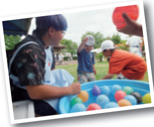
◀ヨーヨー釣りのようす