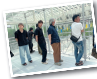
◀クボタアグリフロントを視察するようす