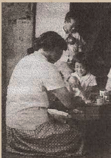
家庭薬を配置している風景

日本の家庭薬と共に歩んできた「JA配置薬」は、これからも健康で豊かな暮らしを応援していきます。