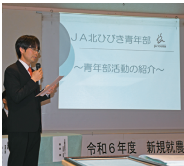
▲青年部活動の紹介のようす▲