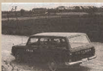
普及推進のため農村に行くクミアイ家庭薬車