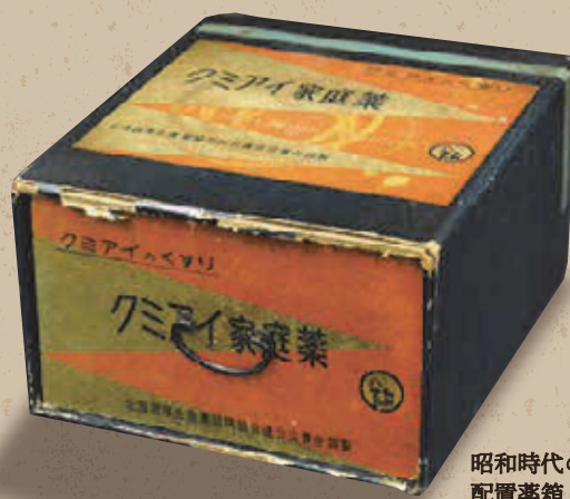
昭和時代の 配置薬箱