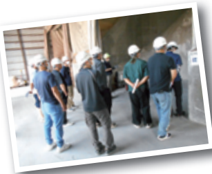
◀住商アグリビジネスのようす